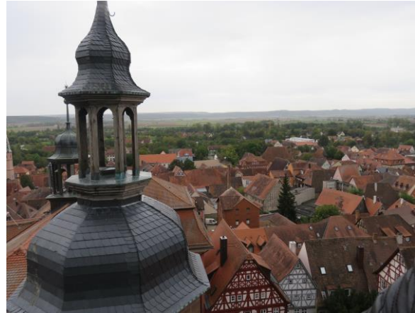
Aussicht vom Turm der St. Kilianskirche